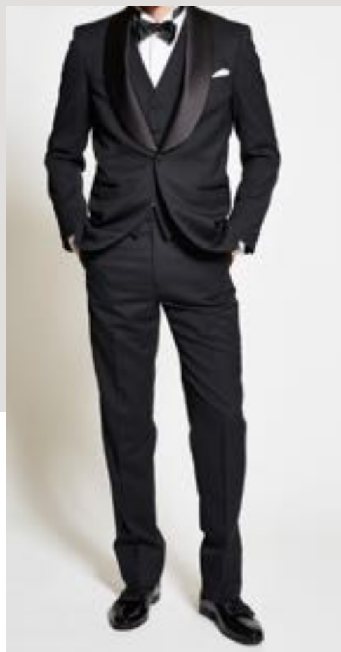
タキシード 夜の正礼装 ブラックタイの指定の際