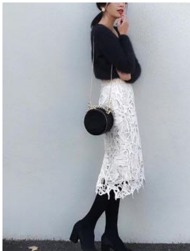
スカートスタイルのスマートカジュアル