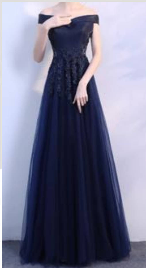
イブニングドレス 夜の正礼装