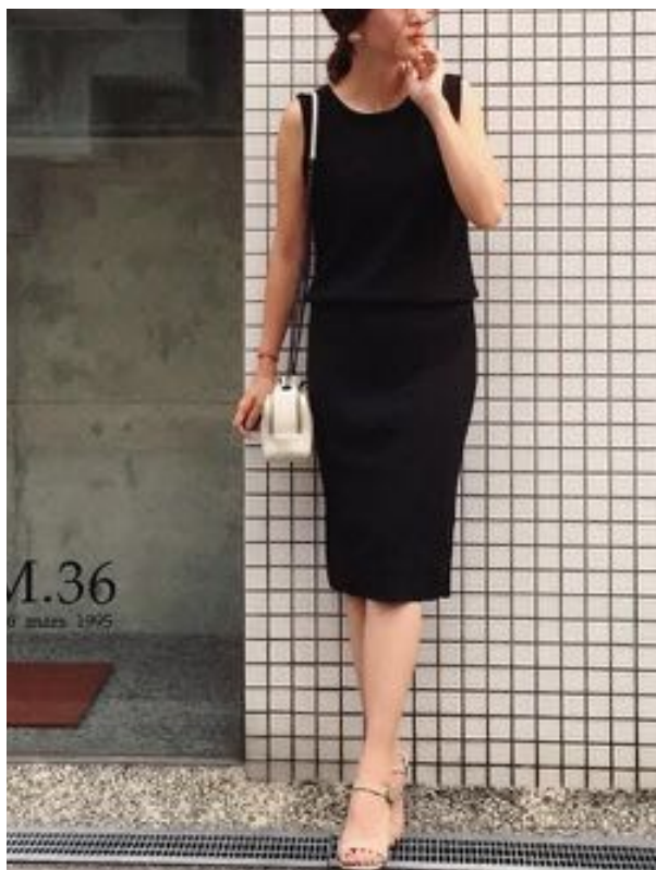
ワンピーススタイルのスマートカジュアル