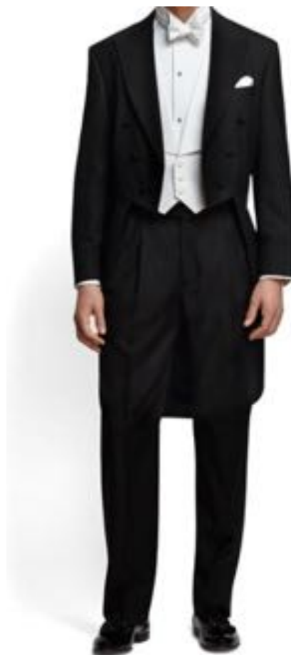
燕尾服(テールコート) 夜の正礼装 ホワイトタイの指定の際