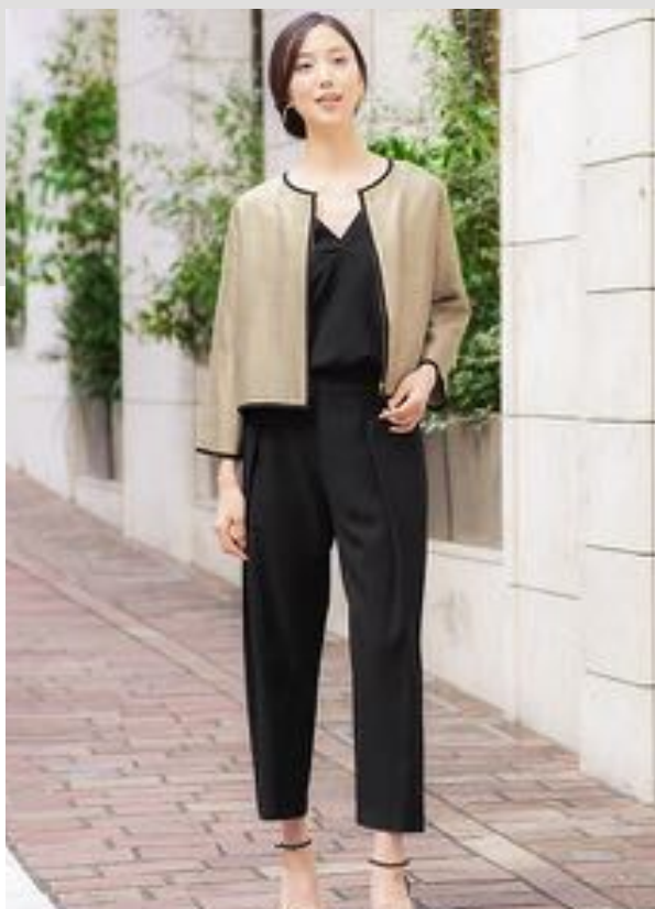
パンツスタイルのスマートカジュアル