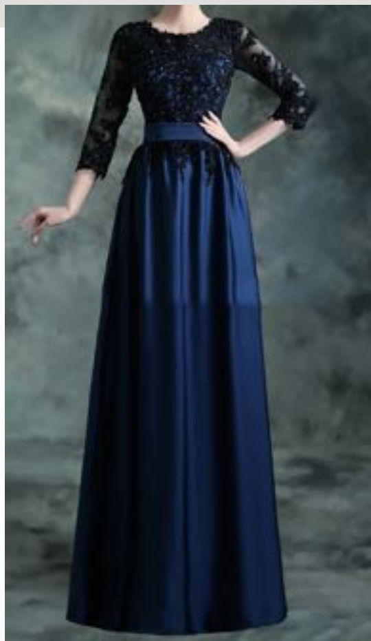
アフタヌーンドレス 昼の正礼装