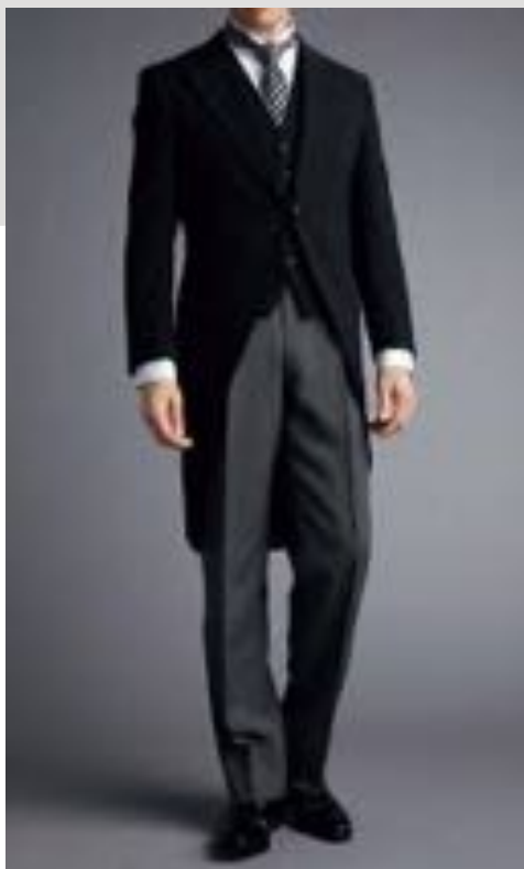
モーニングコート 昼の正礼装