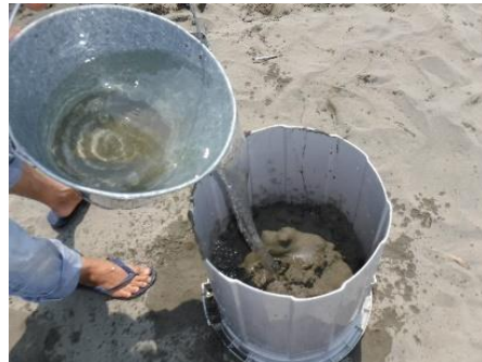
②ポリバケツに1/3ほど砂を入れたあと、海水をたっぷりかけます