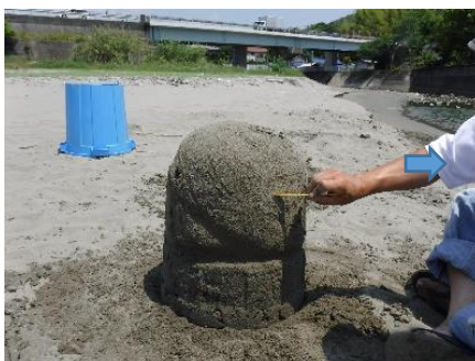
⑦崩れないように少しずつ削り、細かく形を整えていきます