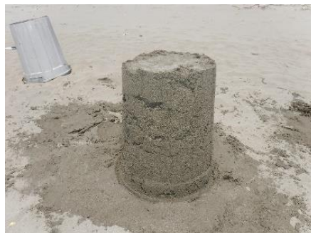
⑤抜けにくいときは、時間を少しあけ、海水が抜けるのを待ちます