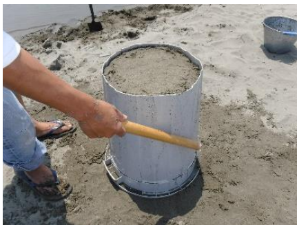
④ポリバケツのまわりをまんべんなくたたき、抜けやすくします