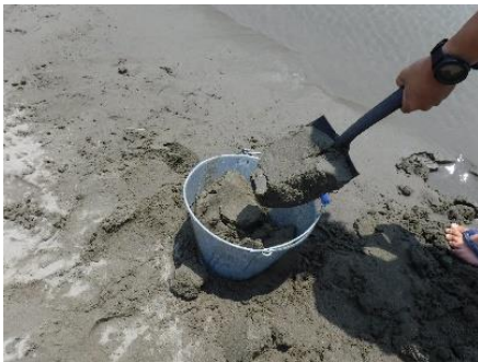
①バケツに少しめった砂を入れます