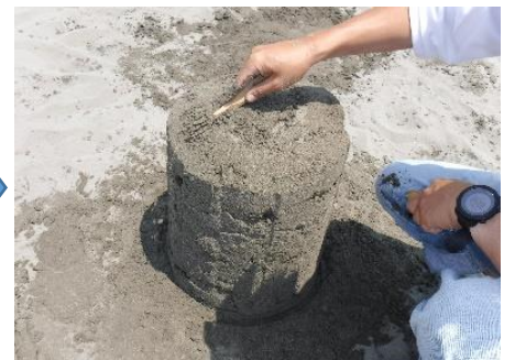
⑥素手またはへらなどで大まかな形に整えます