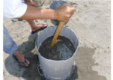
③砂の中に空洞ができないようにしっかり棒でついて固めます。①～③をいっぱいになるまで繰り返します