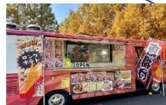
キッチンカー・屋台 (外周道路沿い)