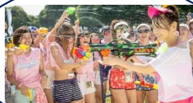
水鉄砲バトルエリア