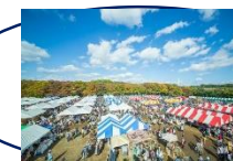
ブース設置スペース