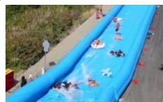
手作りスライダー・幼児用スライダー