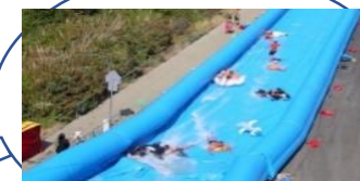
手作りスライダー・幼児用スライダー