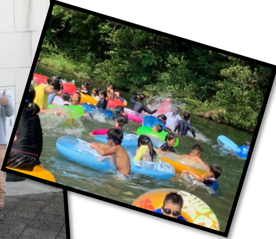
市民フェスティバル