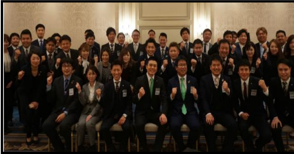
わんぱく相撲 大阪ブロック大会