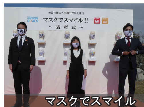
マスクでスマイル

外で遊ぶことが難しい子どもたちのため、『岸和田クエストWALK』を開催しました。カンカン横のアクアパーク緑地を舞台に、子どもたちが大冒険。クイズに答えながら岸和田の歴史や食、文化に触れる機会になりました。