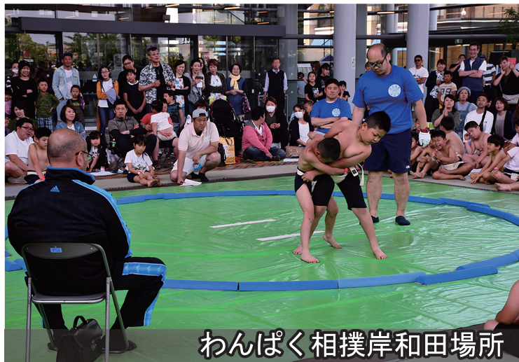
わんぱく相撲岸和田場所