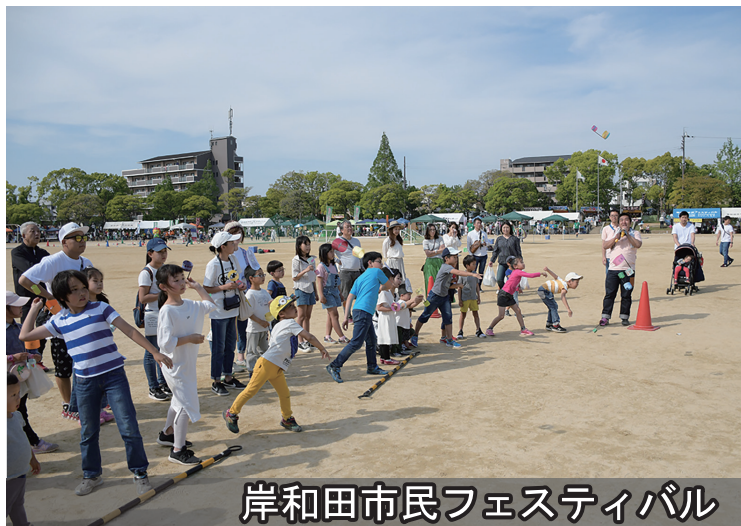
岸和田市民フェスティバル