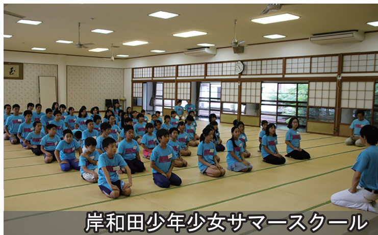
岸和田少年少女サマースクール