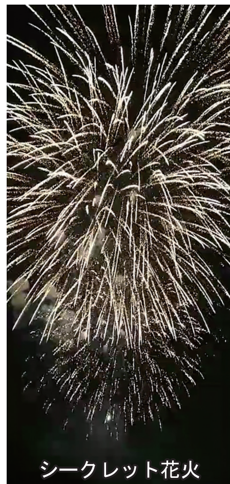
シークレット花火

岸和田に少しでも元気を届けたいと考え、久米田池にてサプライズで花火を打上げました。